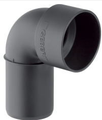
Figura di esempio