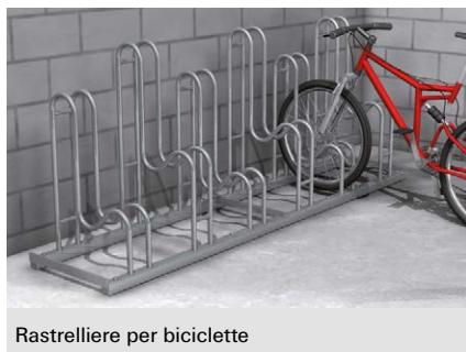
Rastrelliere per biciclette