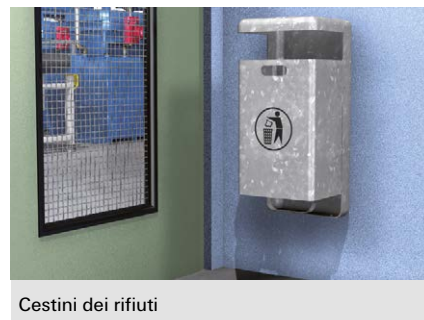
Cestini dei rifiuti