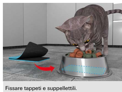
Fissare tappeti e suppellettili.