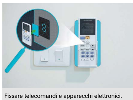
Fissare telecomandi e apparecchi elettronici.