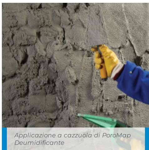
Applicazione a cazzuola di PoroMap Deumidificante