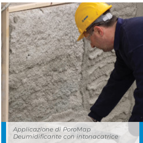
Applicazione di PoroMap Deumidificante con intonacatrice