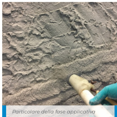
Particolare della fase applicativa