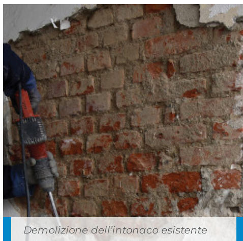
Demolizione dell'intonaco esistente

Per quanto PoroMap Deumidificante contenga dei prodotti che contrastano la comparsa di microfessure è buona norma applicare l'intonaco quando la parete da ripristinare non risulti esposta direttamente ad irraggiamento solare e al vento. In questi casi, così come nei periodi dell'anno caratterizzati da temperature elevate e/o particolarmente ventilati, è opportuno curare la stagionatura dell'intonaco, soprattutto nelle prime 36-48 ore, nebulizzando acqua sulla superficie o impiegando altri sistemi, che impediscano la rapida evaporazione dell'acqua d'impasto.